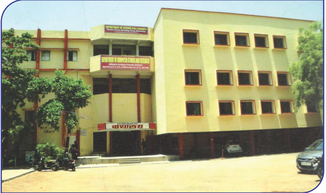
महाविद्यालयातील ग्रंथालय, संगणकशास्त्र, व पदव्युत्तर विभाग इमारत