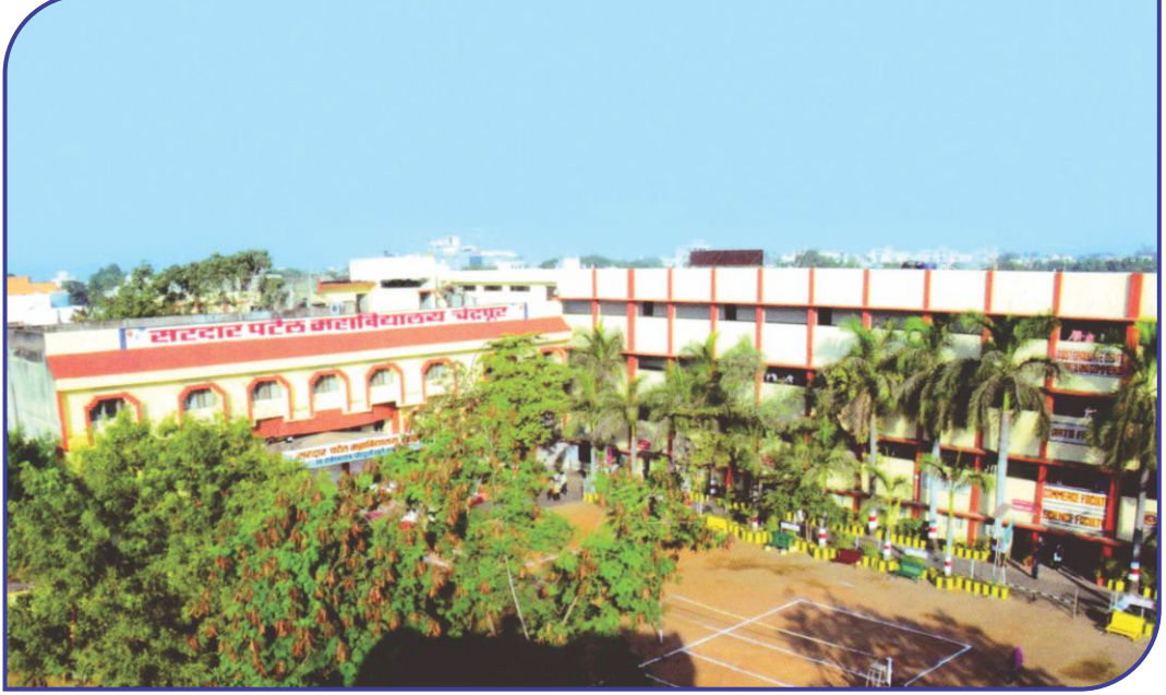
महाविद्यालयाची मुख्य इमारत

(कला, वाणिज्य, विज्ञान, संगणकशास्त्र, गृहशास्त्र, ग्रंथालयशास्त्र, जनसंवाद-पदवी व पदव्युत्तर विभाग)